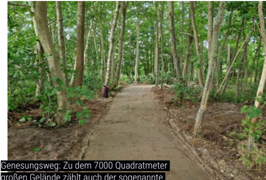
Genesungsweg: Zu dem 7000 Quadratmeter großen Gelände zählt auch der sogenannte Genesungsweg: Hier können Gäste die Natur genießen und Kraft tanken

lerngespräch können Sie sich vor Ort einen Eindruck verschaffen und das Team vom KojenGut und die Einrichtung kennenlernen. Wenn Sie danach verbindlich buchen möchten, erledigt ein*e Mitarbeiter*in gemeinsam mit Ihnen den administrativen Teil.