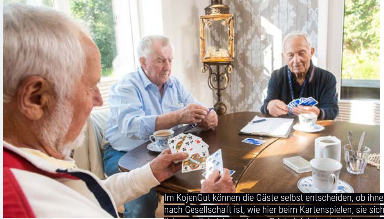
Im KojenGut können die Gäste selbst entscheiden, ob ihnen nach Gesellschaft ist, wie hier beim Kartenspielen, sie sich lieber zurückziehen oder an Erlebnisfahrten teilnehmen wollen

„Pflegerische Angehörige brauchen auch mal einen Abend für sich, wollen ins Theater gehen oder einen Rotwein trinken. Wir machen das möglich.“