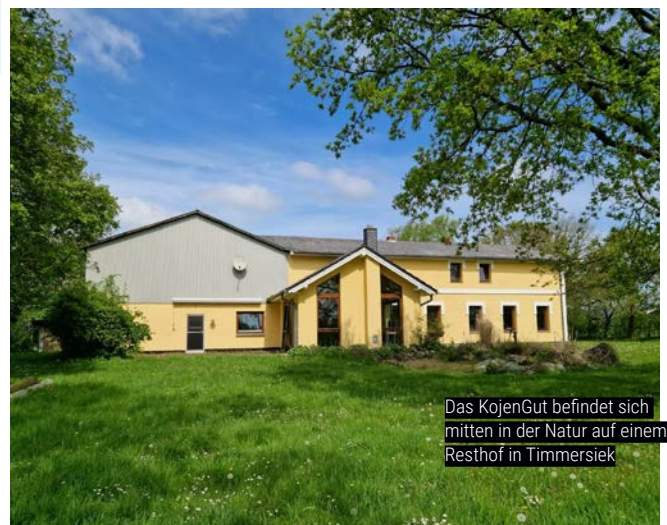
Das KojenGut befindet sich mitten in der Natur auf einem Resthof in Timmersiek